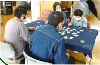
犬も歩けば棒に当たる