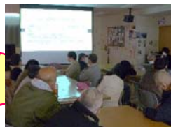
次回は4/22(水) 「我慢しない・させない コミュニケーション」 です

「生活リズムを整える」「人の中で生活する」ことが心と体を調子よく保つために必要だということを確認し、自分自身の生活リズムを振り返りました。好きなことや楽しいことをするために、健康第一!これからも調子を整えていきたいですね。